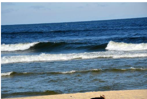
Ciemnoniebieska woda w morzu.