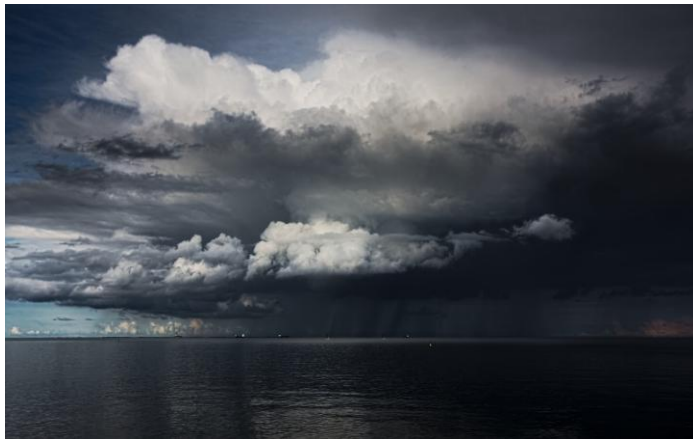
Ciemne, deszczowe chmury.