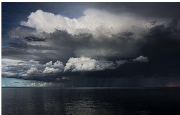
Granatowy kolor wody w morzu - deszczowa pogoda